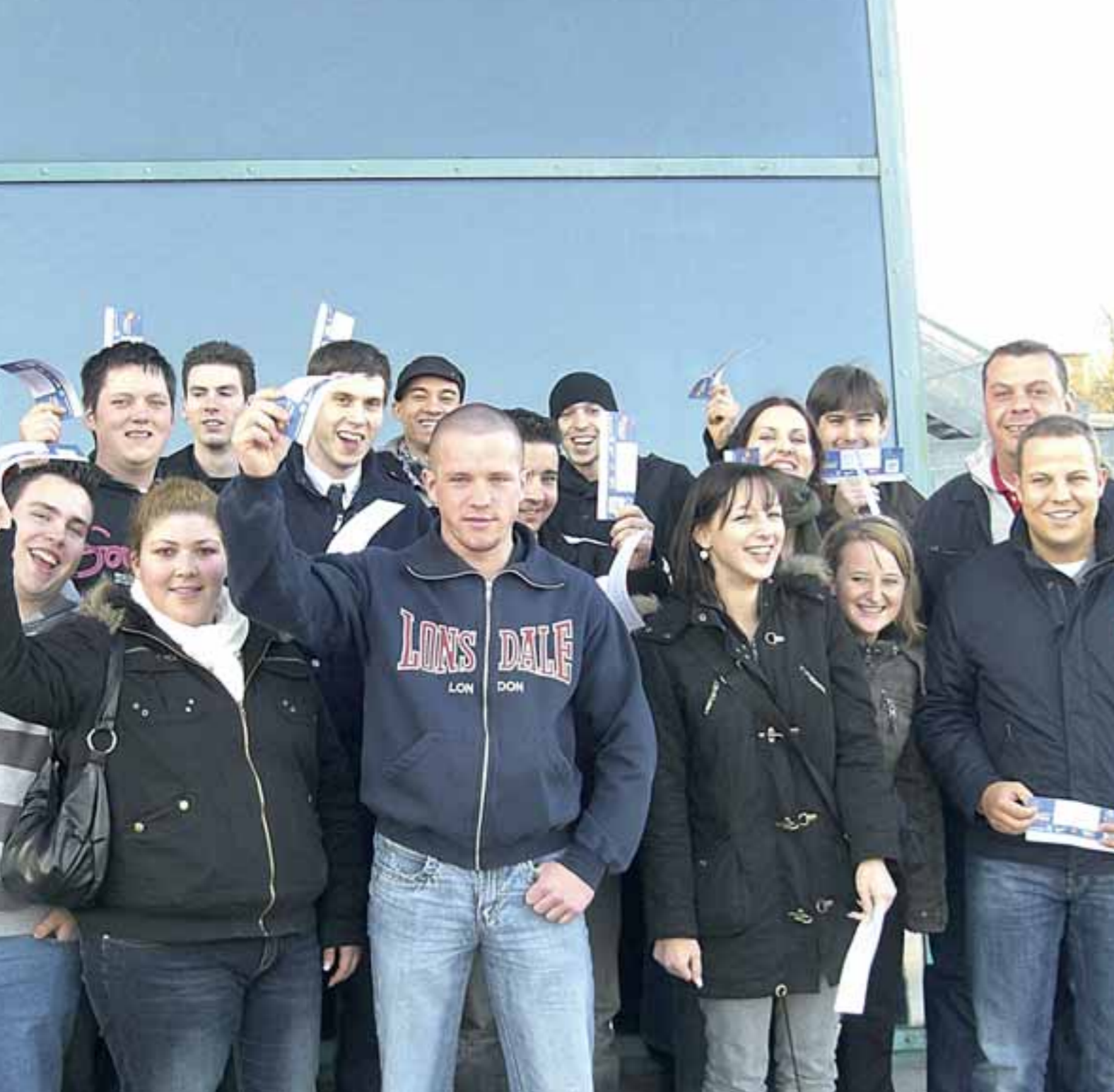
Die All Service Azubis beim Ausflug zum Basketballspiel: Das Thema „Aus- und Weiterbildung“, bei einem gutem Betriebsklima, hat bei All Service seit jeher einen besonders hohen Stellenwert.

Dazu gehören vor allem eine qualifizierte und praxisnahe Aus- und Weiterbildung aber auch das Gefühl, ernst genommen zu werden und ein gutes Betriebsklima insgesamt.“