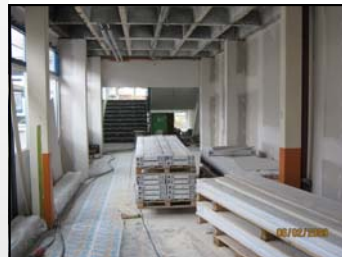
Albert-Einstein-Schule, Haus 4

In den Flurbereichen von den Treppenhäusern werden neue Fensteranlagen, Rauch- und Wärmeabzugsanlagen sowie neue Heizkörper eingebaut. Anschließend werden Maler- und Tapezierarbeiten durchgeführt.